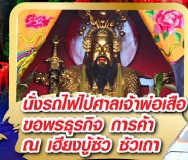
นั่งรถไฟไปศาลเจ้าพ่อเสือ ขอพรธุรกิจ การค้า ณ เชียงมู้อู๋ ชิวเกา