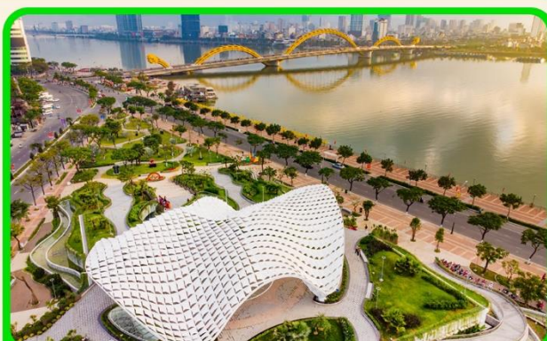
เซ็คอิน แหล่งที่เที่ยวใหม่ APEC PARK