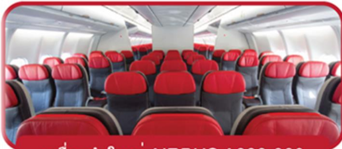
เครื่องลำใหญ่ AIRBUS A330-300 ที่นั่ง 3 - 3 - 3

** ไม่มีบริการอาหารและเครื่องดื่มบนเครื่องบิน แต่มีจำหน่าย ไข่เวลาบินโดยประมาณ 6 ชั่วโมง **