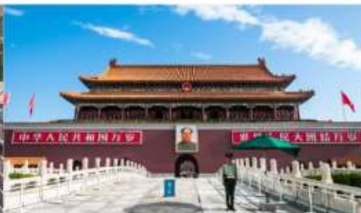
พระราชวังต้องห้ามปักกิ่ง