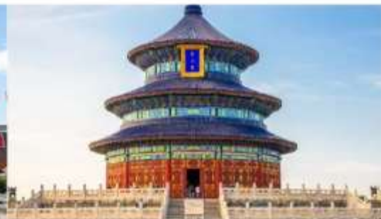
หอสังเกตการณ์ฟ้าเทียนถาน