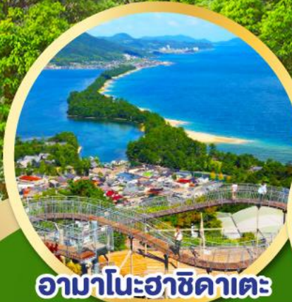
อามาโนะฮาซิดาเตะ