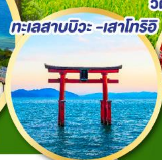
ทะเลสาบบิวะ - เสาโทริอิ