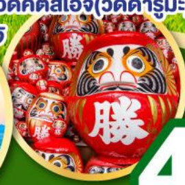
วัดคัตสึโฮจิ(วัดดามมะ)