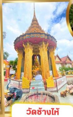
วัดช้างไห้