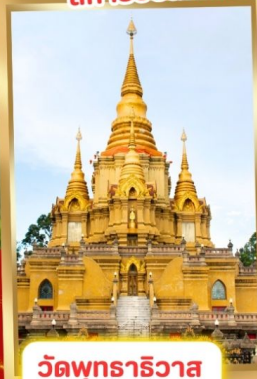
วัดพุทธาริวาส