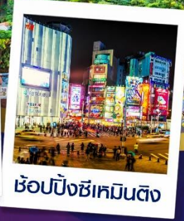
ช้อปปิ้งซีเหมินติง