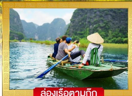
ล่องเรือตามก๊วก