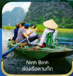
Ninh Binh ล่องเรือตามทิว