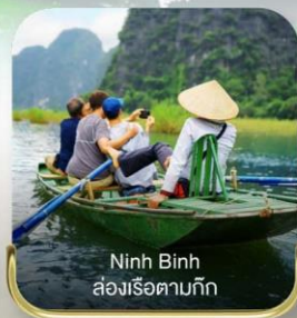
Ninh Binh ล่องเรือตามกัก