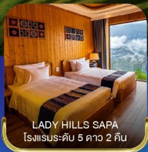
LADY HILLS SAPA โรงแรมระดับ 5 ดาว 2 คืน