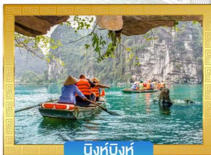
นิงห์บิงห์