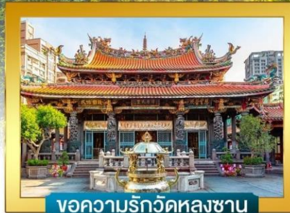
ขอความรักวัดหลงซาน