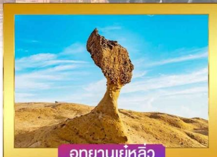
อุทยานเย่หลิว