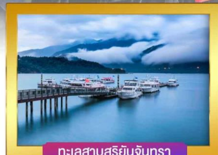
ทะเลสาบสุริยันจันทรา