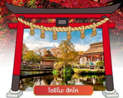
โอิชิโนะ ฮัคโค

เดินทางโดยสายการบิน : ไทยแอร์เอเชียเอ็กซ์