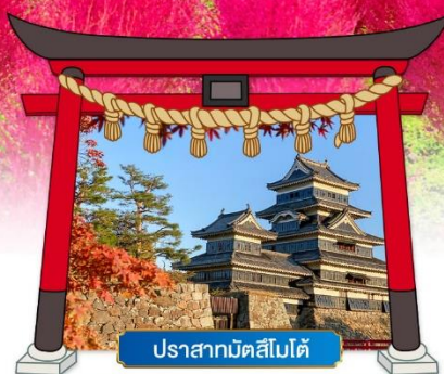
ปราสาทมัตสึโมโตะ