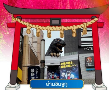
ย่านชินจูกุ

เดินทางโดยสายการบิน : ไทยแอร์เอเชียเอ็กซ์