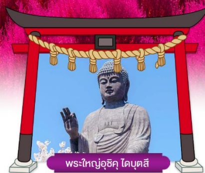
พระใหญ่อุซึ ไดบุตสึ