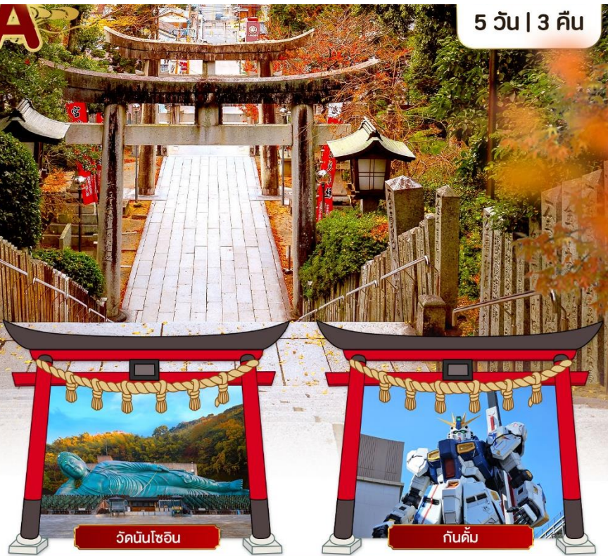
วัดนินโซอิน