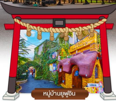
หมู่บ้านยูฟูอิน