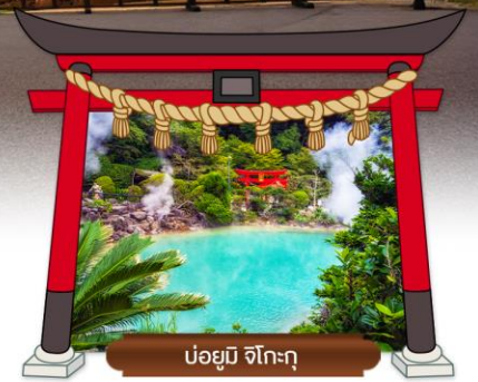
บ่อยูมิ จิโกะกุ