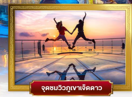
จุดชมวิวกูเกาเจ็ดดาว