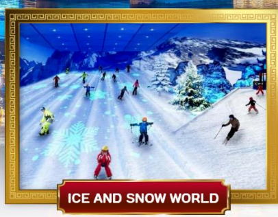
ICE AND SNOW WORLD