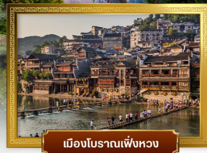
เมืองโบราณเพ็งหวง