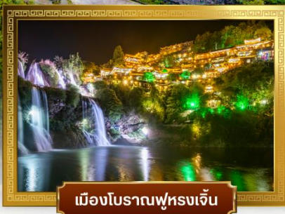
เมืองโบราณฟูหรงเจิน