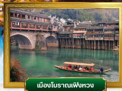
เมืองโบราณเฟิงหวง