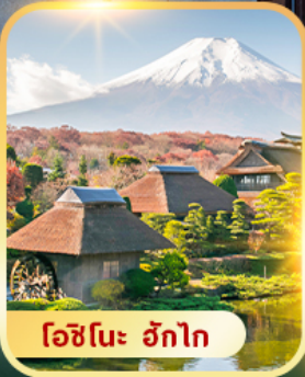
โชนินะ อักโท