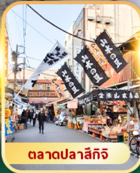
ตลาดปลาสึกิจิ