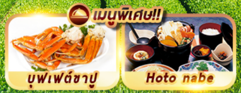
บุฟเฟ่ต์ซาปู