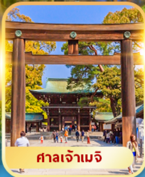
ศาลเจ้าเมจิ