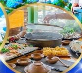
พิเศษ บุฟเฟต์ 2 มือ