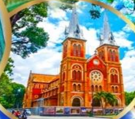
โบสถ์นอร์ทเธอดาม