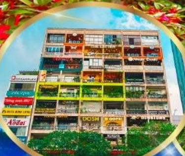
คาเฟ่ อพาร์ทเมนต์