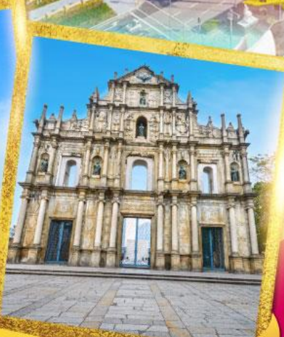
วิหารเซนต์ปอลเซนต์ปอล

เดินทาง 12-14, 16-18 พ.ค. 67 23-25 พ.ค. 67 30 พ.ค.-01 มิ.ย. 67 13-15, 16-18 มิ.ย. 67 20-22, 27-29 มิ.ย. 67 30 มิ.ย.-02 ก.ค. 67