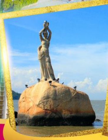
จูไห่พีซเซอร์เกิร์ล