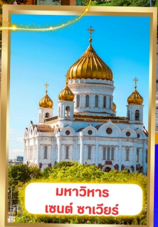
มหาวิหาร เซนต์ ซาเวียร์