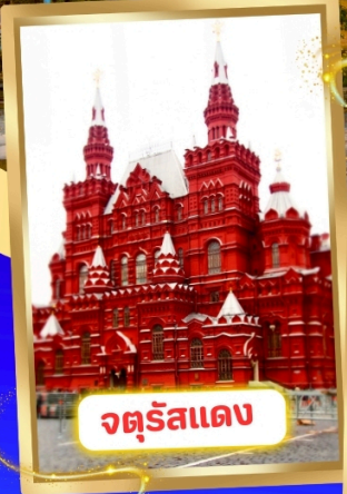
จตุรัสแดง