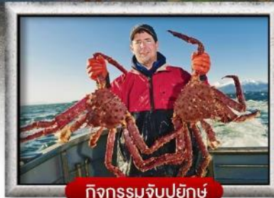
กิจกรรมจับปูยักษ์