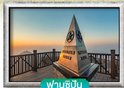
ฟานซีปัน