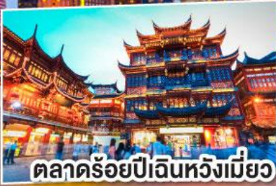
ตลาดร้อยปีเงินหวังเหมียว