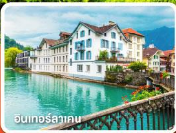
อินเทอร์ลาเคน