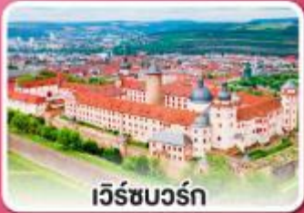
เว็รชบวร์ค