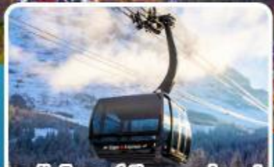
กระเช้า ไอเกอร์เอ็กสเพรส สู่อุดเขาจุงเฟรา

อิตาลี สวิตเซอร์แลนด์ ฝรั่งเศส 10 วัน 7 คืน