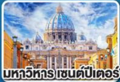
มหาวิหาร เซนต์ปีเตอร์