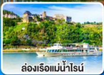
ล่องเรือแม่น้ำไรน์