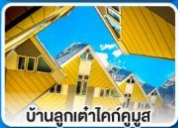
บ้านลูกเต่าโค้คคูมูส