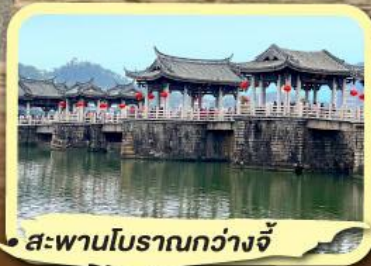
• สะพานโบราณกว่างจี