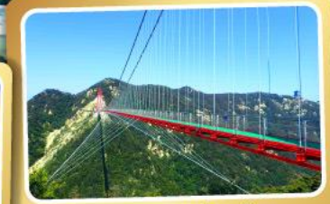
สะพานแวนอ้ายจ้าย