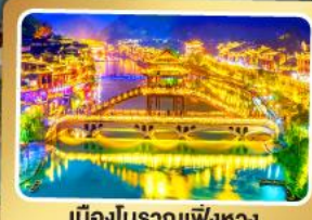
เมืองโบราณเฟิงหวง