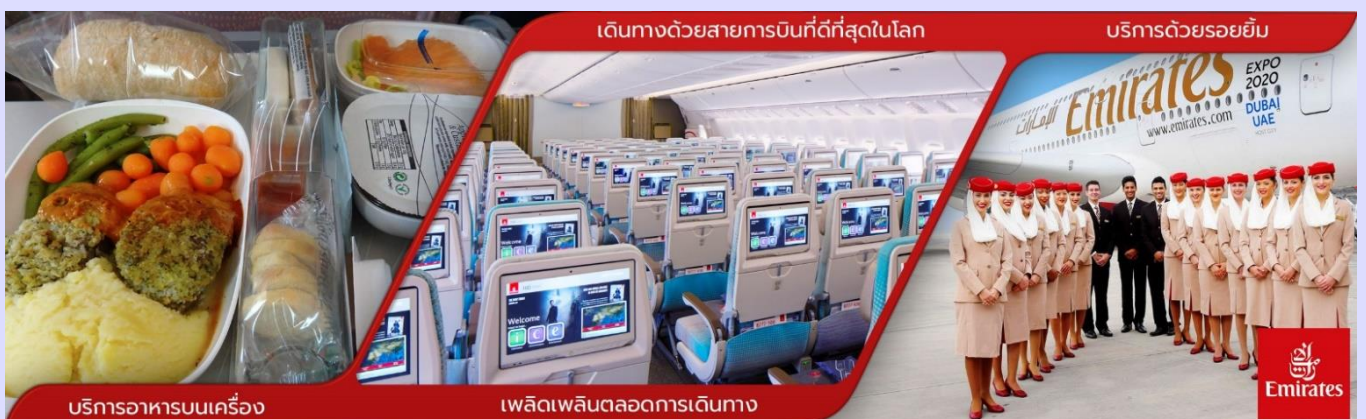
บริการอาหารบนเครื่อง

01.05 ออกเดินทาง สู่สนามบินนานาชาติดูไบ โดยสายการบิน EMIRATES (EK) เที่ยวบินที่ EK385 (บริการอาหารและเครื่องดื่มบนเครื่อง)