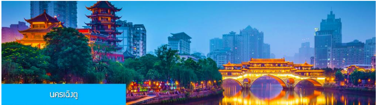
นครเฉิงตู