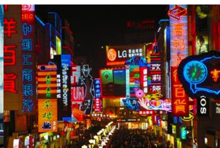
ถนนคนเดินชุนซีลู่