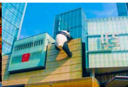
หมีแพนด้าปีนตึก ณ ตึก IFS