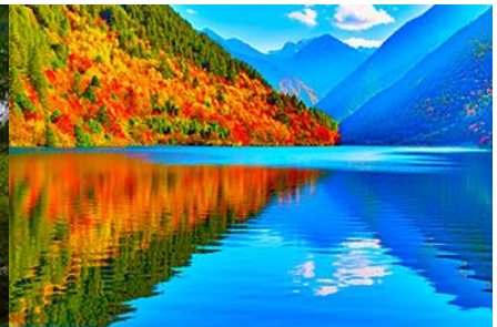
ทะเลสาบแพนด้า