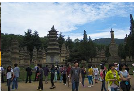
ป่าเจดีย์