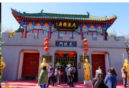
บ้านตระกูลหยาง