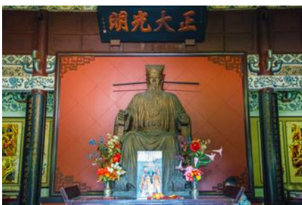
ศาลาเป่าปู้จิ้น

พักที่ โรงแรม MADISON HOTEL HUASHAN 4* หรือเทียบเท่าระดับเดียวกันเมืองเจิ้งโจว