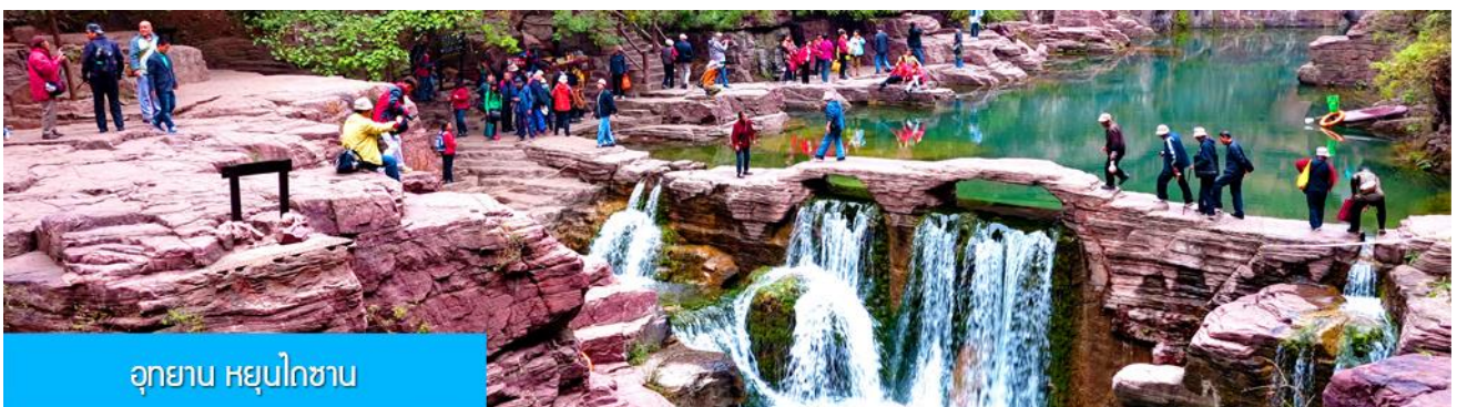
อุทยาน หยุนโกซาน

พักที่ ZHONG ZHUO YI MEI HOTEL 4* หรือ โรงแรมในระดับเดียวกัน เมืองเจียวจั่ว