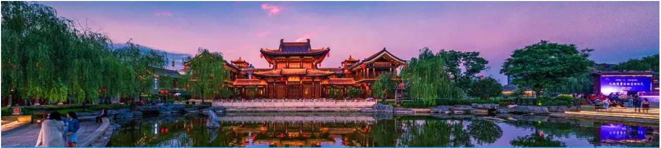
เมืองลั่วหยาง