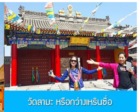
วัดลามะ หรือกว่า๋เหรินชื่อ