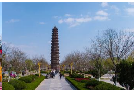
เจดีย์เหล็กแห่งเมืองไคฟง