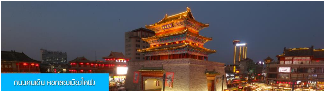
ถนนคนเดิน หอกลองเมืองไคฟง