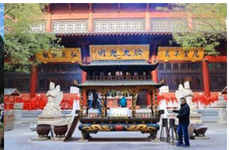
วัดกวนอิมเมืองเจิ้งโจว