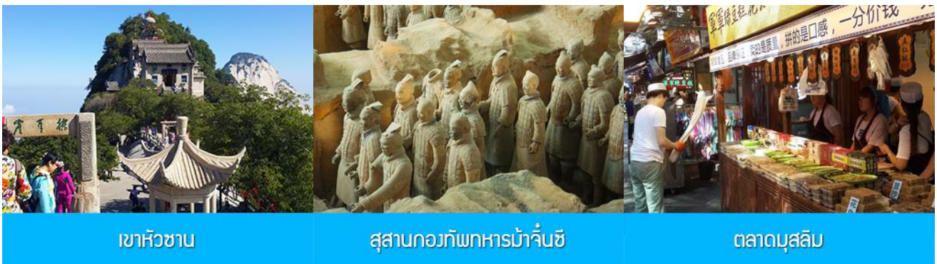
เขาหัวซาน

พักที่ XIN YUAN HOTEL 4* หรือ โรงแรมในระดับเดียวกัน เมืองหัวซาน