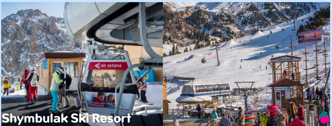
Shymbulak Ski Resort

นำท่านขึ้นกระเช้าสู่ ชิมบูลัก สกีรีสอร์ท สกีรีสอร์ทที่ใหญ่และทันสมัยของอัลมาตี แวดล้อมด้วยเทือกเขาสูงที่ปกคลุมด้วยหิมะขาวโพลนบนยอด ป่าสนอายุหลายร้อยปี และทะเลสาบในหุบเขา ซึ่งท่านสามารถชมทิวทัศน์ที่สวยงามของเมืองจากมุมสูงท่ามกลางสายลมหนาวอันสดชื่น จากสกีรีสอร์ทแห่งนี้ พื้นที่ของรีสอร์ทประกอบด้วยลานสกีและเครื่องเล่นสำหรับกิจกรรมหิมะ