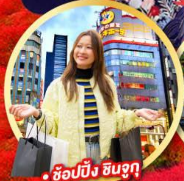
• ช้อปปิ้ง ซินจูกุ

กิจกรรมใส่ชุดกิโมโน พร้อมชมโชว์การแสดงต่างๆ