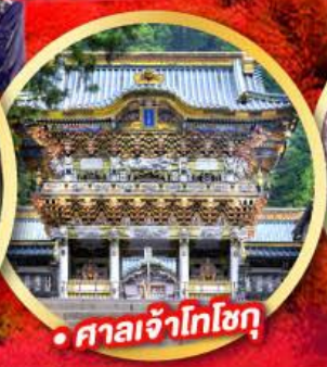
• ศาลเจ้าโทโฮกุ