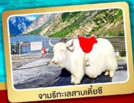
จามริกะเลสาบเตี้ยซี