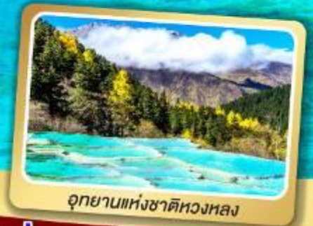
อุทยานแห่งชาติหลวงหลง