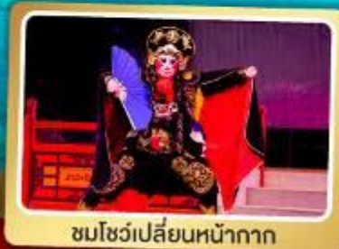
ชมโชว์เปลี่ยนหน้ากาก