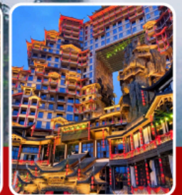
ตึก 72 ชั้น