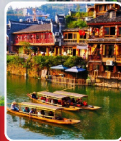
เมืองโบราณฟ่งหวง

อุทยานฉางเจียเจี๋ย เขาเทียนจื่อซาน สะพานหนึ่งโถงไม้ ทะเลสาบเป่าเฟิงหู ตึกมหัศจรรย์ 72 ชั้น เมืองโบราณฝูหลงเจิน เมืองโบราณฟ่งหวง ล่องเรือแม่น้ำถิวเจียง สะพานสายรุ้ง ช้อปปิ้ง ถนนคนเดินหวงซิงลู่