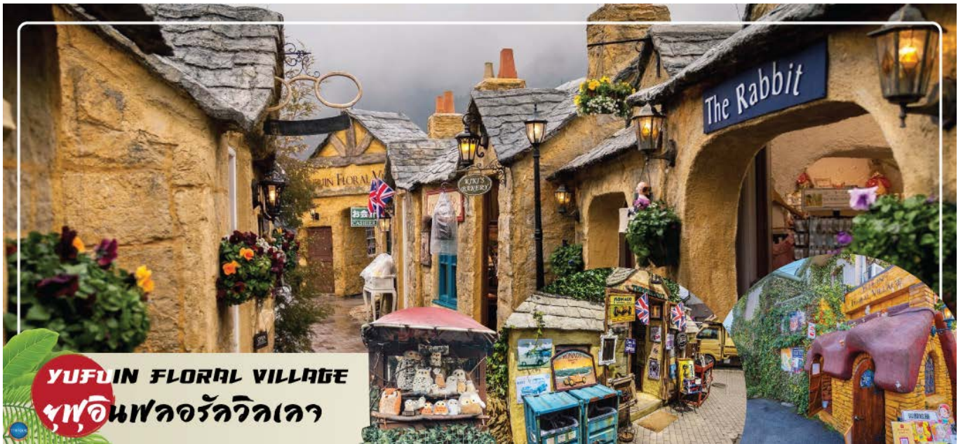
YUFUIN FLORAL VILLAGE ยูฟุอินฟลอรัลวิลเลจ