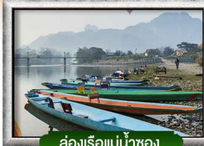
ล่องเรือแม่น้ำซอง