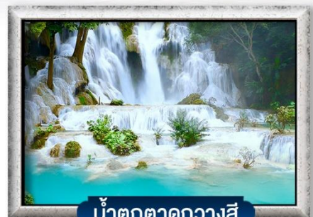
น้ำตกตาดกวางสี