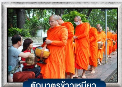
ตักบาตรข้าวเหนียว