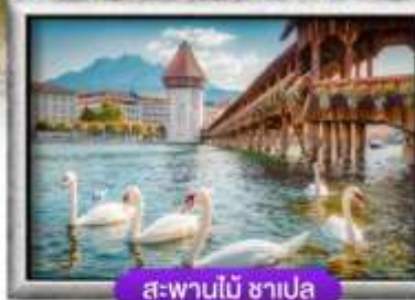
สะพานไม้ ซาเปลา