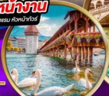
สะพานไม้ ชาเปล