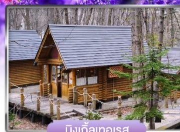
นิงเกิ้ลเทอเรซ