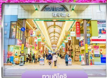
ซาปโปโรโคจิ