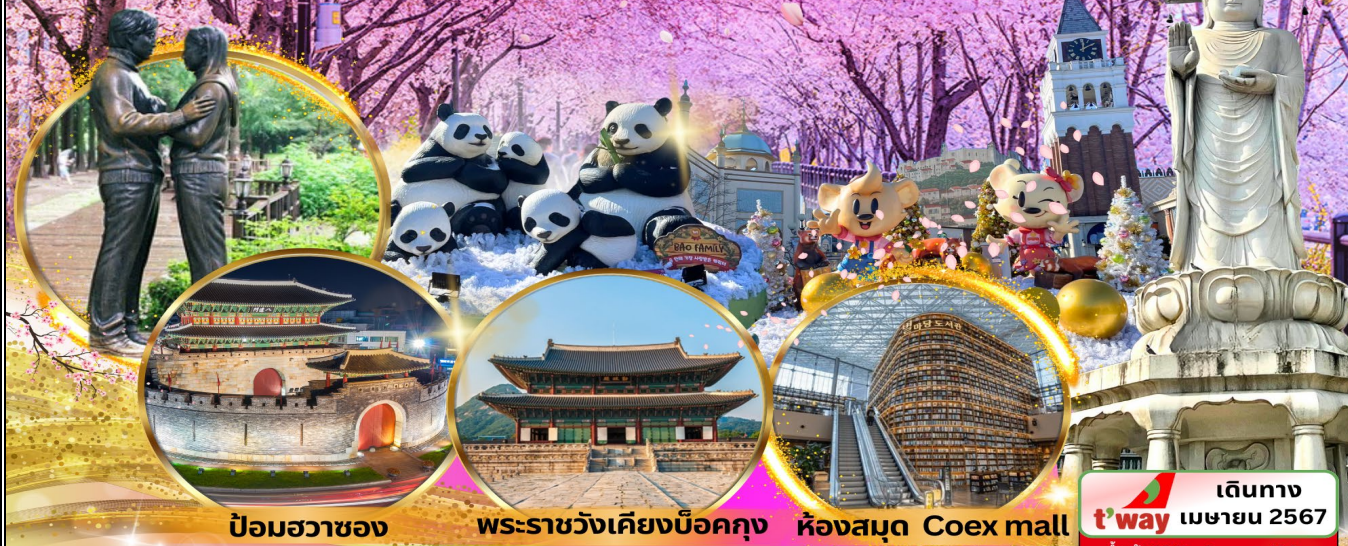
ป้อมฮวาซอง