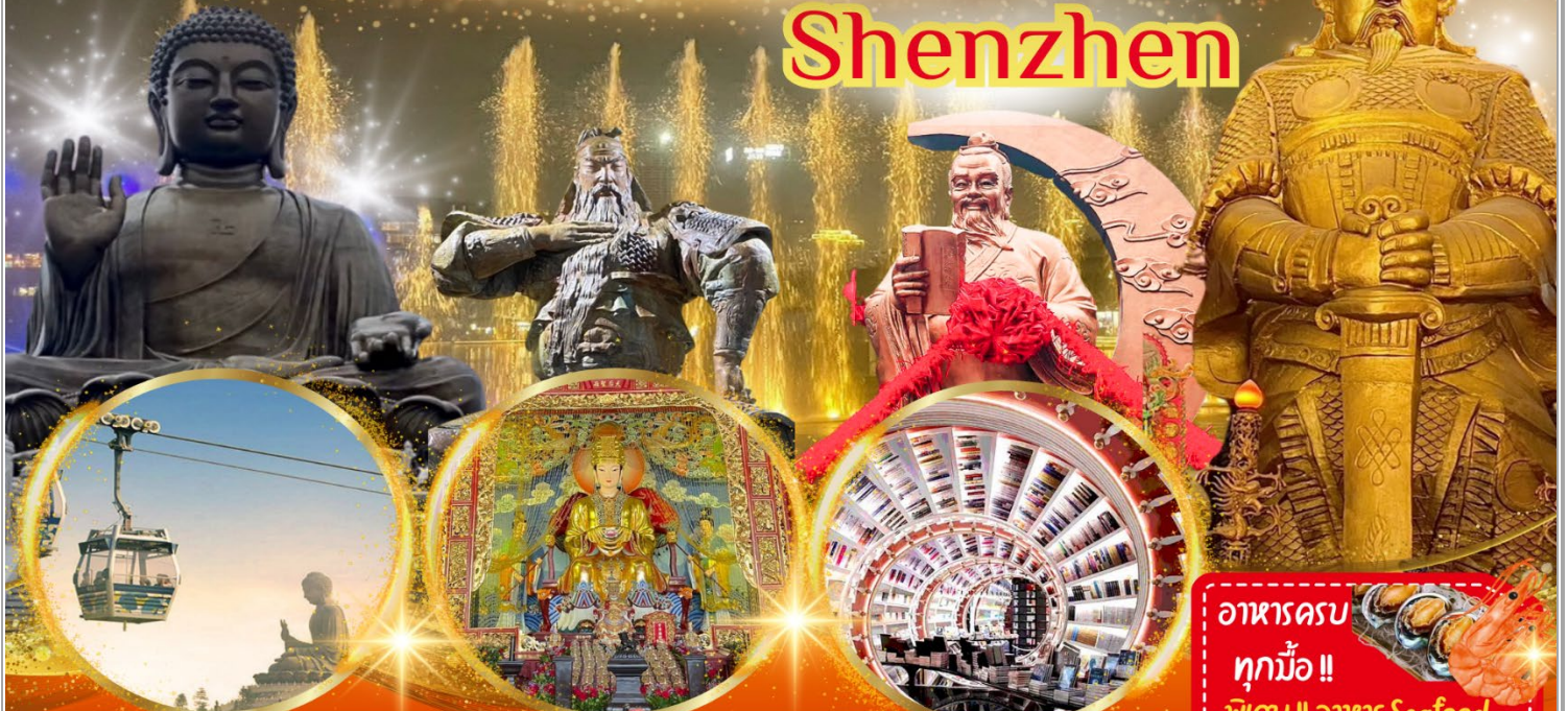
กระเช้าลอยฟ้าองปิง