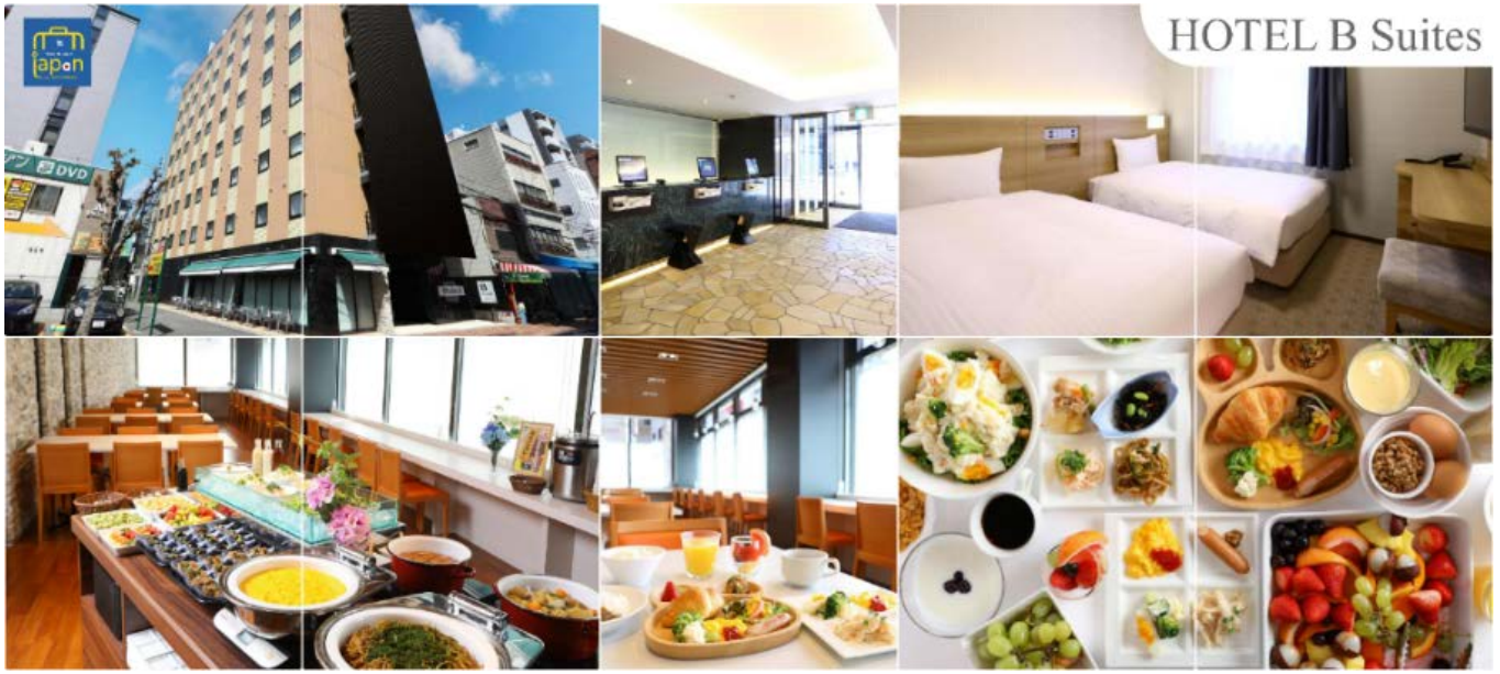
HOTEL B Suites

พักที่ HOTEL B SUITES NAMBA, OSAKA หรือเทียบเท่าระดับเดียวกัน