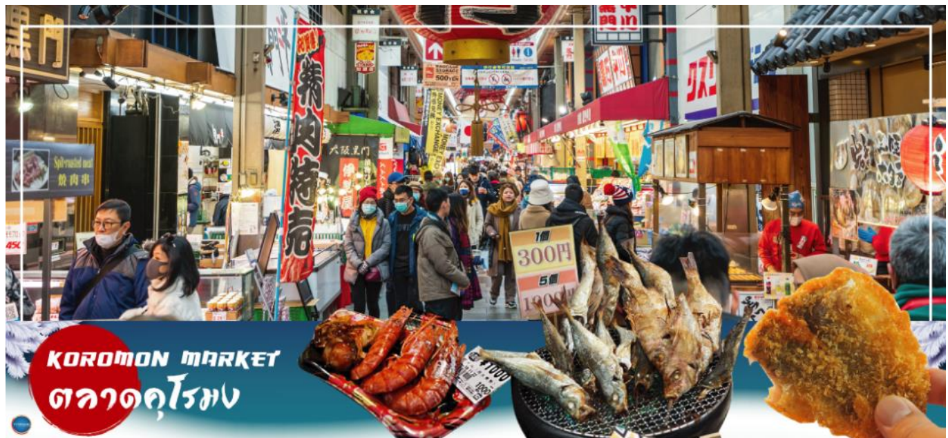
KOROMON MARKET ตลาดคุโรมง

วันที่สี่ เมืองโอซาก้า – ปราสาทโอซาก้า(ด้านนอก) – ตลาดคุโรมง – ห้างอิออน มอลล์ ริงกุ เซ็นัน – ท่าอากาศยานนานาชาติคันไซ โอซาก้า