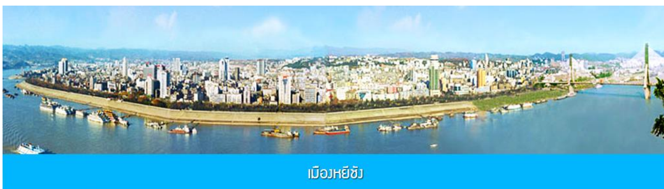
เมืองหยีซาง