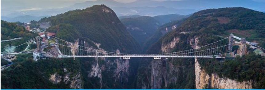
สะพานกระจกจางเจียเจี๋ย