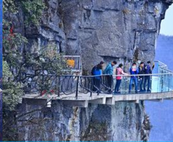
หน้าพลาวยฟ้ากาวเดินกระจก